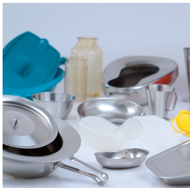
Amigo kan brukes til å rengjøre og desinfisere beholdere for menneskeavføring, i en lang rekke fasonger og størrelser.

Amigo er en toppmatet enhet som er laget for tilgang i benkehøyde. Forsiden er lavere enn baksiden, slik at tilgangen blir bredere når lokket er åpent. Dermed blir den enkel å fylle, tømme og overvåke. Dette gjør det også enklere å tømme rengjøringsbøtter og andre store beholdere når Amigo brukes som en utslagsvask.