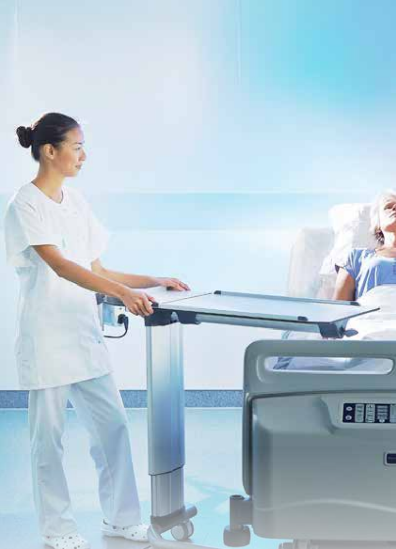
INTERMEDIÄRVÅRDS- OCH MEDICIN-/ KIRURGIIVDELNINGAR