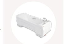
Classic Line 2

1. Goto et al (2014). Physical and mental effects of bathing: A Randomised Intervention Study. Evidence-Based Complimentary and Alternative Medicine. Volume 2018, Article ID 9521086. 2. Branco M, Rêgo NN, Silva PH et al. Bath thermal waters in the treatment of knee osteoarthritis: a randomized controlled clinical trial. Eur J Phys Rehabil Med. 016;52(4):422-30. 3. Silva A, Queiroz SS, Andersen ML, et al (2013). Passive body heating improves sleep patterns in female patients with fibromyalgia. Clinics (Sao Paulo) 68(2): 135-139. 4. Knibbe NE, Knibbe JJ (1996). Postural Load of nurses during bathing and showering of patients: Results of a laboratory Study. American Society of Safety Engineers. November. 37-39.