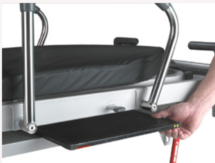
Lifeguard 50 & 20 over de hele lengte in hoogte instelbaar röntgenplatform