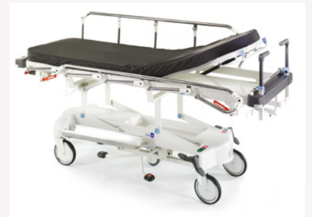
LG 20 getoond in gebroken wit

Lifeguard biedt de gebruiker allerlei functies om zorgbeheer in zorgomgevingen te ondersteunen. De veelzijdige LG 20-brancard biedt een grotere keuze aan gebruikersgedefinieerde opties en kan worden aangepast aan verschillende behoeften en budgetten. Mogelijke opties zijn o.a. een in hoogte verstelbaar röntgencassette-platform en een Easitrack 5e zwenkwielsysteem.