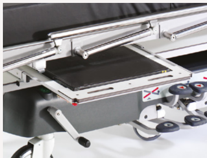
Lifeguard 55 verschuifbare röntgencassettehouder

Brancards uit de Lifeguard range kunnen beeldvormingstechnieken over de gehele lengte ondersteunen met behulp van conventionele röntgencassettes en C-boogsystemen. (N.b.: niet geschikt voor gebruik met MRI-apparatuur)