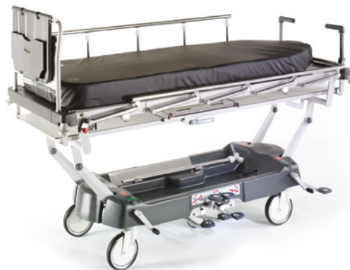
Bi-Flex matrass afgebeeld op LG 55 brancard