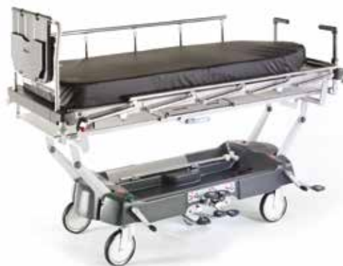
Bi-Flex Matratze - gezeigt auf der Transportliege LG 55