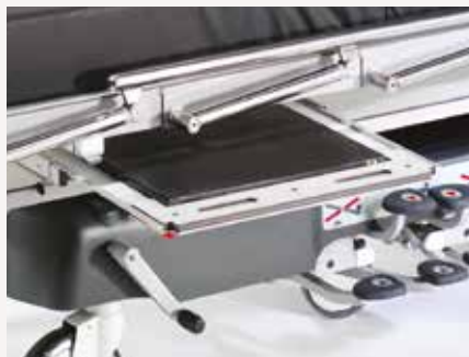
Lifeguard 55: Verschiebbarer Röntgenfilmkassettenhalter

Die Transportliegen des Lifeguard-Sortiments ermöglichen das Röntgen des Patienten von Kopf bis Fuß anhand von herkömmlichen Röntgenkassetten- und C-Bogen-Systemen. (Hinweis: nicht zur Verwendung mit MRT-Geräten geeignet)