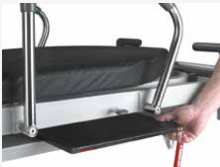
Lifeguard 50 & 20: Anhebbare Röntgenplattform über die volle Länge