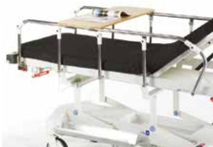
TISCH ZUM ANKLEMMEN