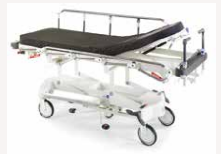
LG 20 in Grauweiß

Der Lifeguard bietet dem Benutzer verschiedene Merkmale und Funktionen zur Unterstützung des Patientenmanagements im Gesundheitswesen. Die vielseitig einsetzbare Transportliege LG 20 bietet jetzt eine noch größere Auswahl an benutzerdefinierten Optionen und ist an unterschiedliche Ansprüche und Budgets spezifisch anpassbar. Zur Auswahl stehende Optionen umfassen eine anhebbare Röntgenplattform und Easitrack-Lenkrollensystem mit 5. Rad.