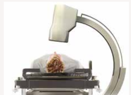
Lifeguard 55: C-Bogen Zugriff über die volle Länge