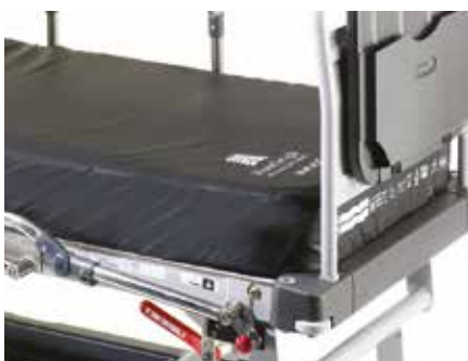
MONITOR-/DOKUMENTENHALTERUNG Standard für die Modelle LG 55 und LG 50