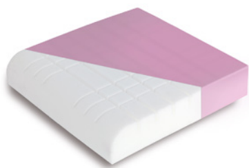
24-timmars vårdpaket - sittdyna tillgänglig