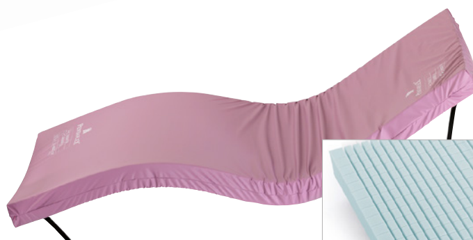
En toppmadrass är också tillgänglig och lätt att installera