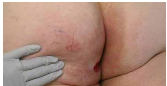
C. Zustand der Wundumgebung - 18 Tage nach Lagerung auf der Skin IQ