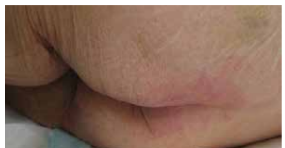
D. 17 Tage nach Lagerung auf der Skin IQ