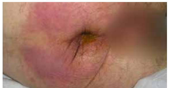
B. 6 Tage nach Lagerung auf der Skin IQ MCM