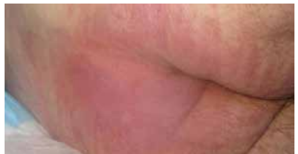
C. 27 Tage nach Lagerung auf der Skin IQ MCM