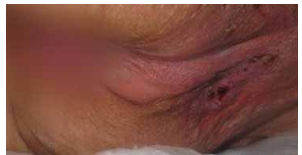
C. 27 Tage nach Lagerung auf der Skin IQ MCM