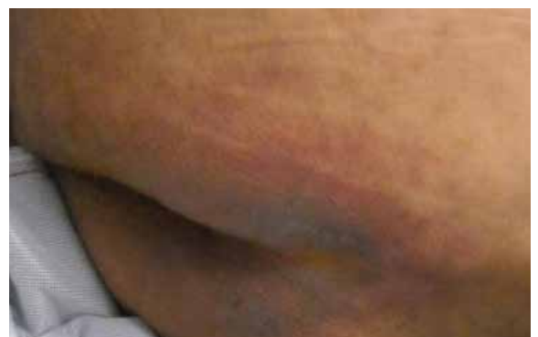
C. 18 Tage nach Lagerung auf der Skin IQ MCM