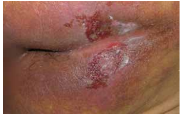
A. Erstschäden der Haut

Name der Einrichtung: Baylor Specialty Hospital Standort der Einrichtung: Dallas, Texas, USA