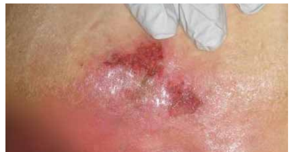
B. 6 Tage nach Lagerung auf der Skin IQ MCM