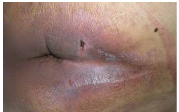
B. 5 Tage nach Lagerung auf der Skin IQ MCM