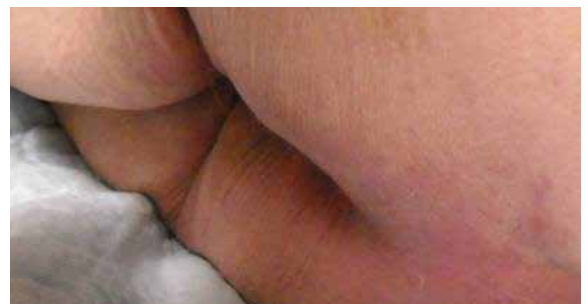
C. 14 Tage nach Lagerung auf der Skin IQ