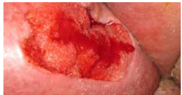
B. Zustand der Wundumgebung - 7 Tage nach Lagerung auf der Skin IQ