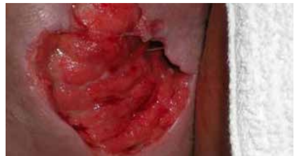
A. Rupturierter Abszess mit Hautläsion

Name der Einrichtung: Baylor Specialty Hospital Standort der Einrichtung: Dallas, Texas, USA