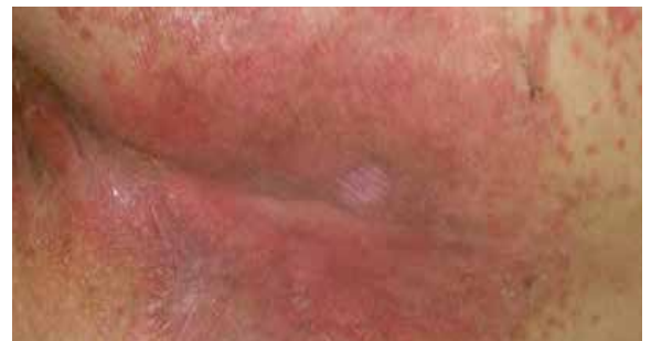
A. Erstschäden der Haut

Name der Einrichtung: Baylor Specialty Hospital Standort der Einrichtung: Dallas, Texas, USA