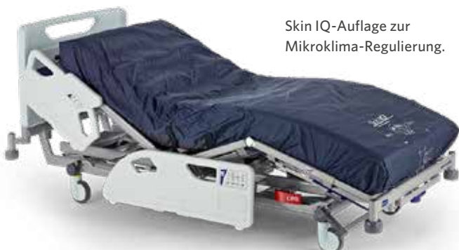
Skin IQ-Auflage zur Mikroklima-Regulierung.

Diese Broschüre bietet einen Überblick über die Betauflage Skin IQ Mikroklima Manager und stellt Bewertungen und Fallstudien vor, um ihre praktische Anwendung und Leistungsfähigkeit in der klinischen Umgebung darzulegen.