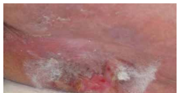
D. Nachuntersuchung an Tag 30 (nach Transfer auf Low Air Loss)