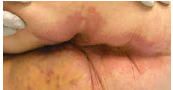
A. Erstschäden der Haut

Name der Einrichtung: Baylor Specialty Hospital Standort der Einrichtung: Dallas, Texas, USA