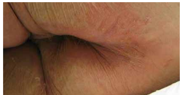
B. 7 Tage nach Lagerung auf der Skin IQ