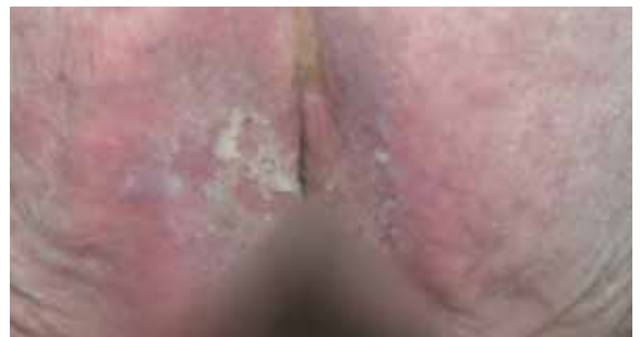
A. Erstschäden der Haut

Name der Einrichtung: Baylor Specialty Hospital Standort der Einrichtung: Dallas, Texas, USA