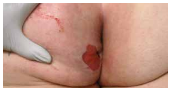
D. Zustand der Wundumgebung - 20 Tage nach Lagerung auf der Skin IQ